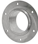
SLF RS manşon